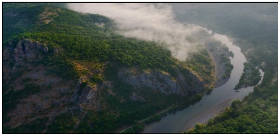
Die Arda-Schlucht aus der Luft, Madzharovo, östliche Rhodopen, Bulgarien

Die Rhodopen befinden sich südöstlich von Bulgariens Hauptstadt Sofia. Sie sind wunderschöne und weitläufige Berge und bei den Menschen vor Ort auch als die „Berge des Orpheus“ bekannt. Denn hier hat angeblich jener sagenumwobene Musiker das Licht der Welt erblickt. Der Legende nach konnte er mit seiner Musik nicht nur wilde und gefährliche Bestien, sondern auch die Felsen der Berge und die Bäume des Waldes bezaubern.