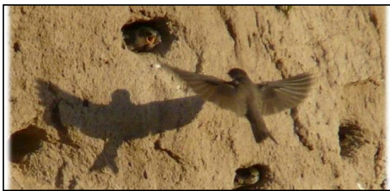
Uferschwalbe in einer Abbaustätte von HeidelbergCement

Der Bedeutung von Steinbrüchen und Kiesgruben für viele Pflanzen und Tiere in Europa ist seit langem bekannt. Jedoch setzen sich erst seit kurzem die Abbaunternehmen für einen kontinuierlichen und großflächigen Schutz der biologischen Vielfalt in ihren Abbaustätten ein. Die Branche hat erkannt, dass der Schutz der Umwelt für ihre Unternehmen von großer Bedeutung ist.